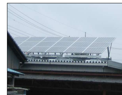
O様邸車庫の屋根に設置