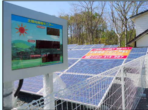
環境エンジニア山中湖発電所 48.6kw